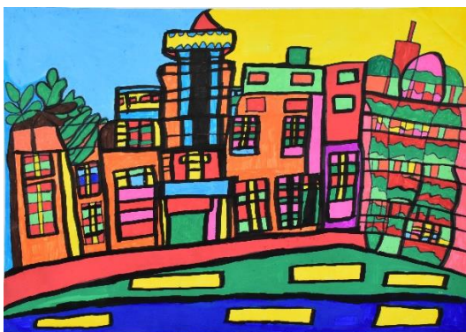
「戸畑図書館」 川崎 光男