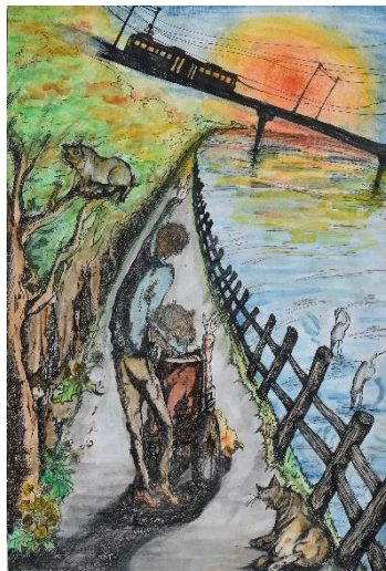
「この街で生きる ～私の今は、あなたの未来～」 MARU