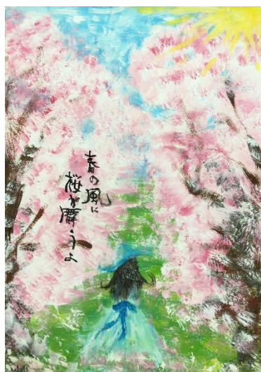
キミは…桜のようせい かもネ♥