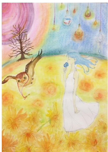
たんぽぽ畑で みつけて