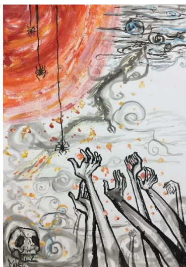
自分の手をつかみとれ