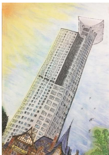
門司港レトロの図