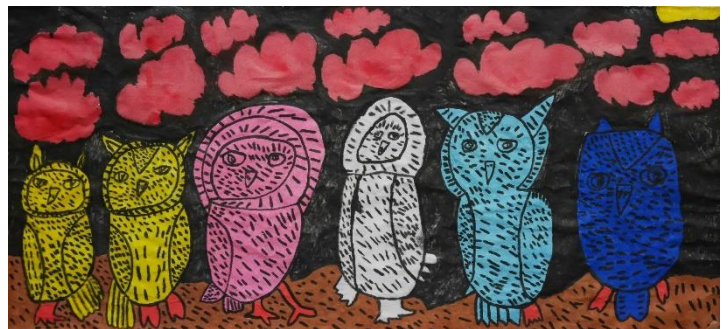
「ふくろう」 日吉 優太