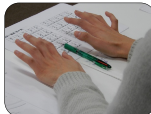
机で練習中(左)、講師に指点字で伝える様子(右)