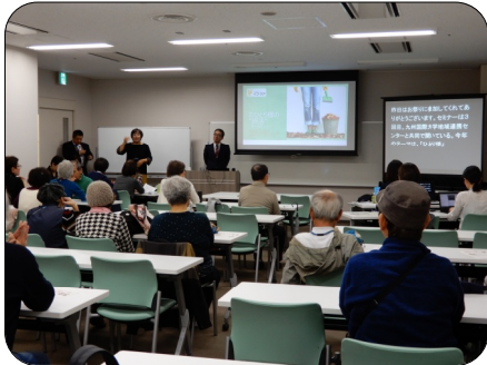
熱心に話を聞く参加者のみなさん