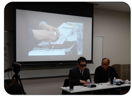
ブレイルセンスの使い方を解説

最後になりましたが、ご協力いただいた盲ろう者のみなさん、講師陣のみなさん、ありがとうございました。そして、受講生のみなさんもお疲れ様でした。今後ともよろしくお願いいたします。